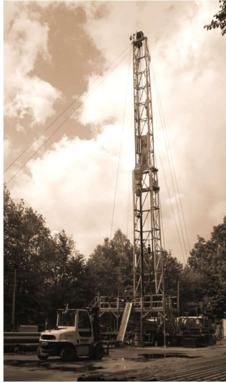
Die Workover-Winde Cabot Franks 650 während einer Verfüllungsarbeit.